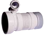
MANGUITO EXTENSIBLE WC CON TOMA 40 mm