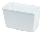
CISTERNA PLÁSTICO 9 LITROS