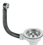
VALVULA CESTA C/REBOSADERO