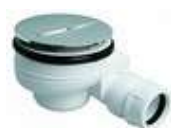
VALV. PLATO DUCHA S-320