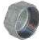
FIG. 300 TAPON HEMBRA