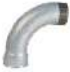
FIG.1 CURVA 90° M-H