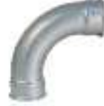
FIG.2 CURVA 90° H-H